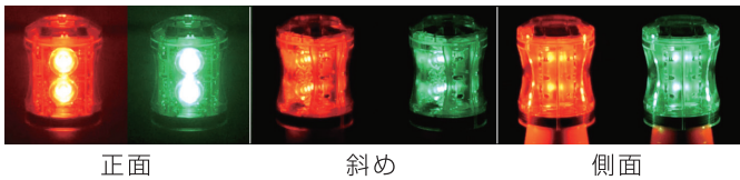
正面 斜め 側面

円筒状のため、斜めや側面から見た際も発光部位が広く、どの角度からも視認性良好です。